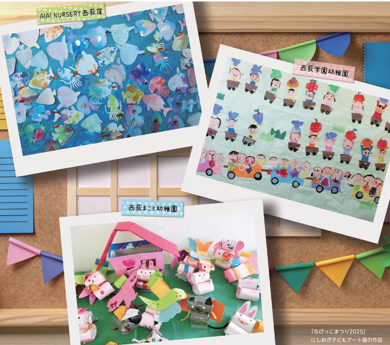
「ちびっこまつり2025」 にしおぎ子どもアート展の作品