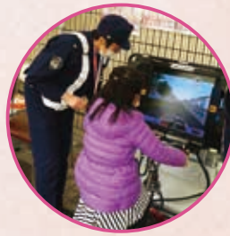
人気の自転車シミュレーター