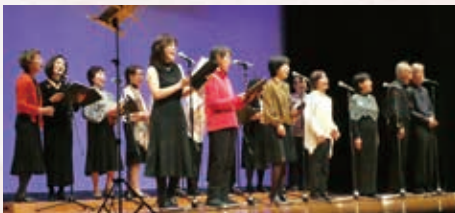
西荻レインボーシンガーズ