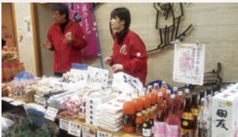
おぢやファンクラブの名産品販売