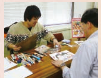
個性あふれる似顔絵