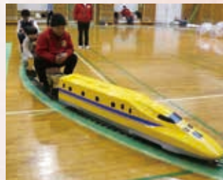
走るミニ新幹線模型