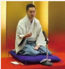
昔々亭慎太郎師匠の高座に大笑い