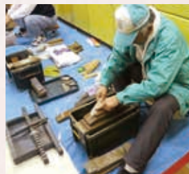
毎度お馴染み包丁研ぎ