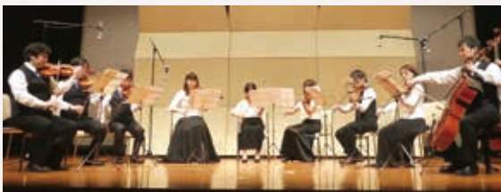
カプリースキッズアンサンブル