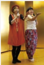
くれないぐみによる漫談