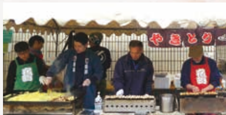
宿町町会のみなさんは焼そばや焼き鳥を販売