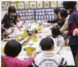
「ものの会」さん主催の絵てがみ