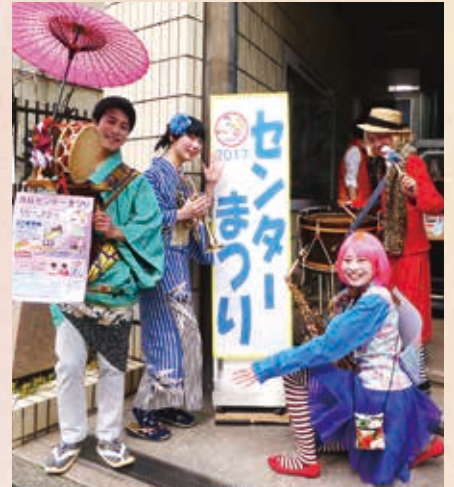
楽しいちんどんの調べに足を止める人も

<ご報告> センターまつりでお寄せいただいた「杉並区次世代育成基金」への募金合計は5,083円となりました。ご来場くださいました皆様のあたたかなご支援に感謝いたします。