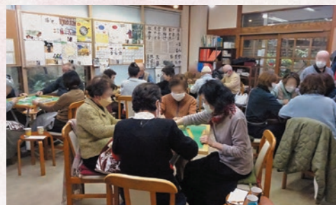
麻雀の会は女性でにぎわっています

認定NPO 法人ももの会が運営する、お食事と交流の場。地域のさまざまな年代の方々が、気軽に立ち寄り、おしゃべりをしたり、相談事をしたり、趣味活動をしたり、生きがいと出会いの場。